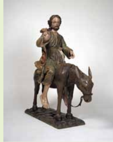
Christus op de palmezel, Duitsland, circa 1600-1650

Op palmzondag lopen kinderen in een optocht met palmpaasstokken die ze versierd hebben met groene takjes, paaseieren en een broodhaantje.