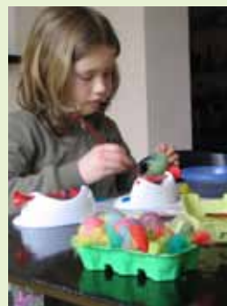
Eieren schilderen.

de kinderen vroeger geloofden dat de kerkklokken op Witte Donderdag naar Rome (waar de paus woont) vlogen? Op paaszaterdag kwamen de klokken dan weer terug en strooiden ze de paaseieren uit.