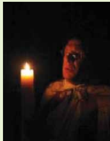
Een pastoor zingt bij de paaskaars.

Pasen is het feest van een nieuw begin. Christenen herdenken met Pasen dat Jezus na zijn dood uit zijn graf is opgestaan. De dood is voor de christenen niet het einde, maar een overgang naar een eeuwig leven.