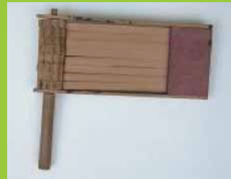
Ratel voor de Goede Week, Nederland, ca. 1900-1950, StCC v64a

deze houten ratel soms wordt gebruikt in katholieke kerkdiensten op Witte Donderdag, Goede Vrijdag en paaszaterdag? Hij vervangt dan de altaarschel. In de Goede Week is het geluid van de ratel aangrijpend vanwege het ernstige en serieuze karakter van de viering.